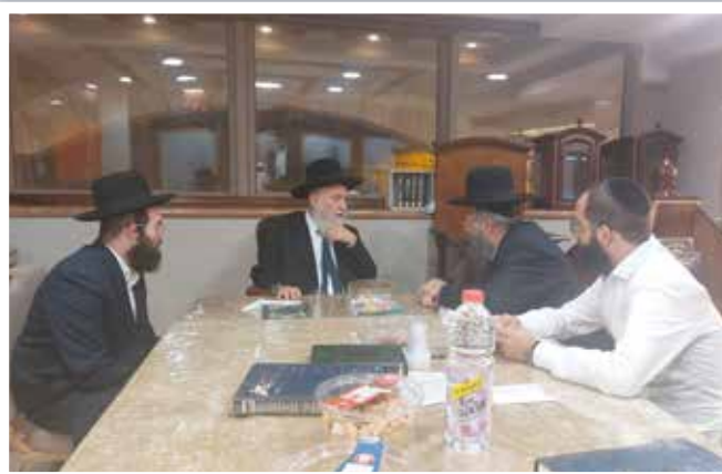
הגאון רבי ראובן אלבז |