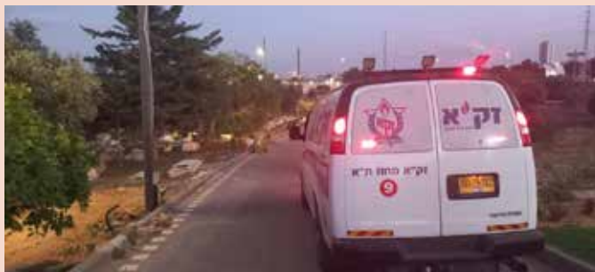
| אמבולנס זק"א ת"א בבית הקברות טאסו |

מטפלים וחולקים כבוד לכל אדם באשר הוא אדם ללא הבדל דת מין וגזע, כי כל אדם נברא בצלם ובטח מי שנהרג על היותו במדינת ישראל."