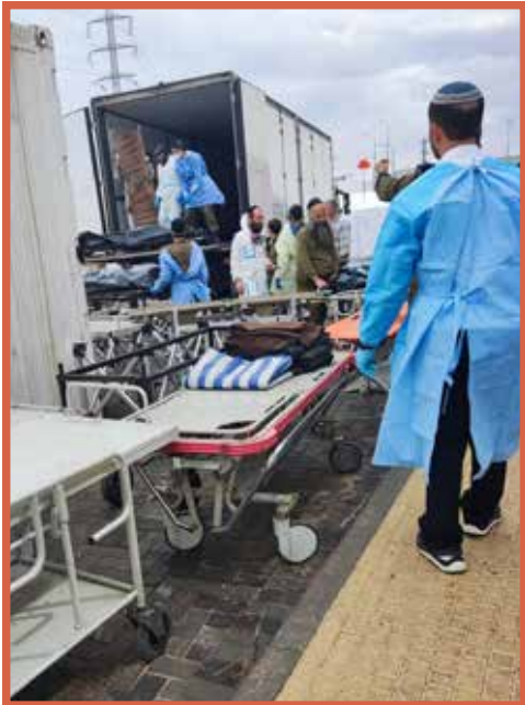
משאיות באות והולכות ובמטענן גופות החללים |