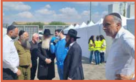
האדמו"ר רבי דוד חנניה פינטו שליט"א במחנה שורה |