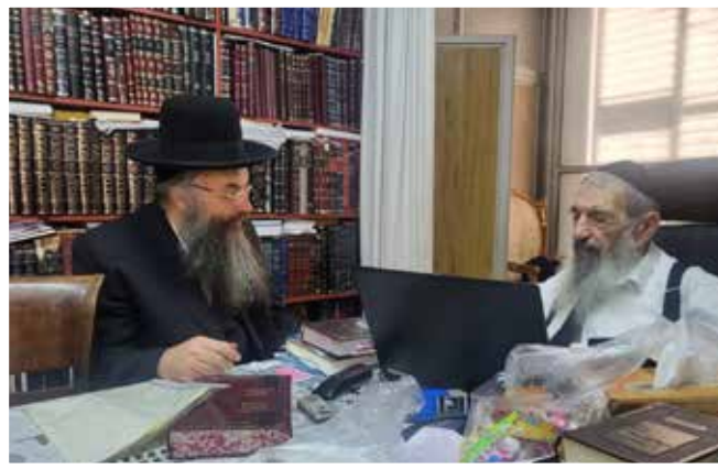
| הגאון רבי ניסים בן שמעון |