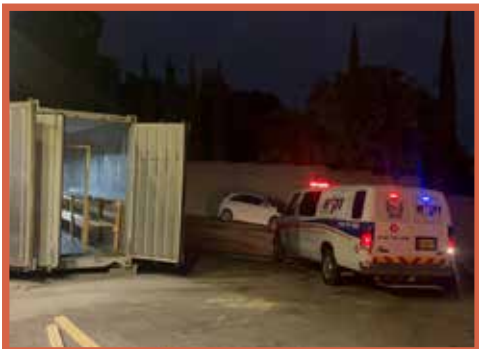
אמבולנס זק"א מעמיס נפטרים לקבורה מהמכולה במחנה שורה |

כבר שבוע חלף בתוך הזוועה, מראות מחרידים, ריח הגופות החרוכות והמרוטטות באויר והנה באה שבת. הרבנות הצבאית דאגה לכך שיהיה זמן למנוחה והפוגה, הכינו לנו אוהל ללינה, סעודות שבת במשמרות ובתי כנסת מאולתרים. חיילים בצבע זית, שוטרים במדים, אנשי משרד הבריאות באפודים ומתנדבי זק"א בשטריימלים ומלבושי שבת, כולם סביב שולחן אחד, עושים קידוש, ופוצחים בשירת "ישראל בטח בה". התפריט הוא אחד לכולם, היו כאלה ששפר עליהם גורלם במשלוחים מהבית, אבל רובם גם על שולחן השבת ראשם בתר"ח, מחשבותיהם נודדות למראות, לשיחות עם המשפחות הצובאים על הכניסות לקבל פיסת מידע על יקירם או על הבית שנשאר מאחור.