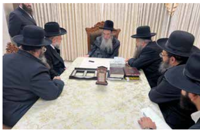
כ"ק האדמו"ר מאלכסנדר |