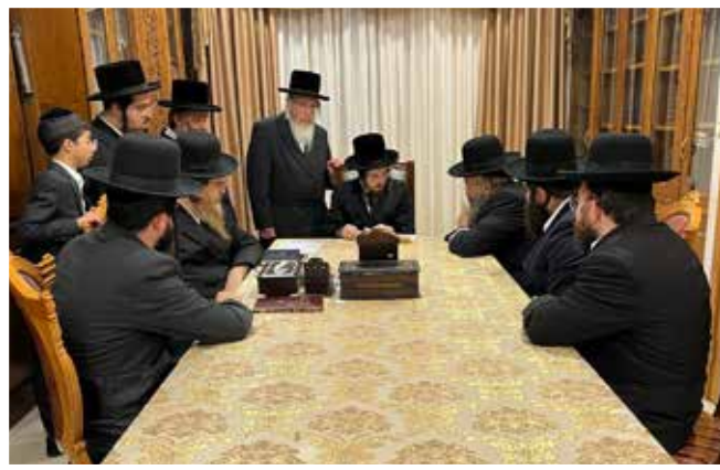
| כ"ק האדמו"ר מסאדיגורא |