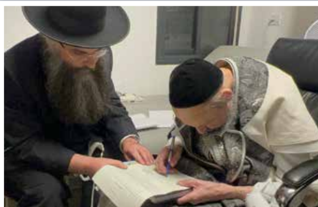
| הגאון רבי דב קוק |