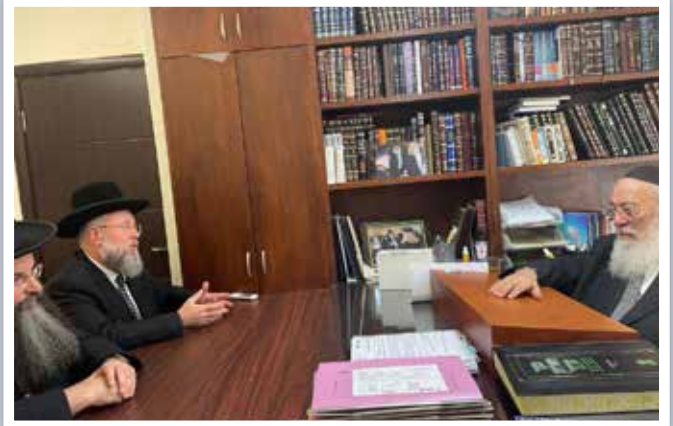
| הראשלי"צ הגאון רבי שלמה משה עמאר |