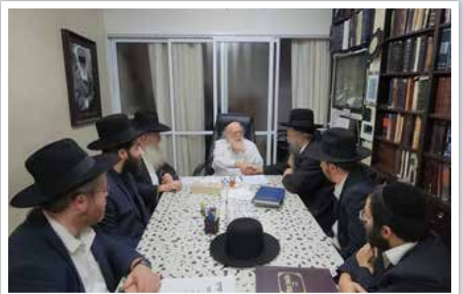
הגאון רבי שמעון גלאי |