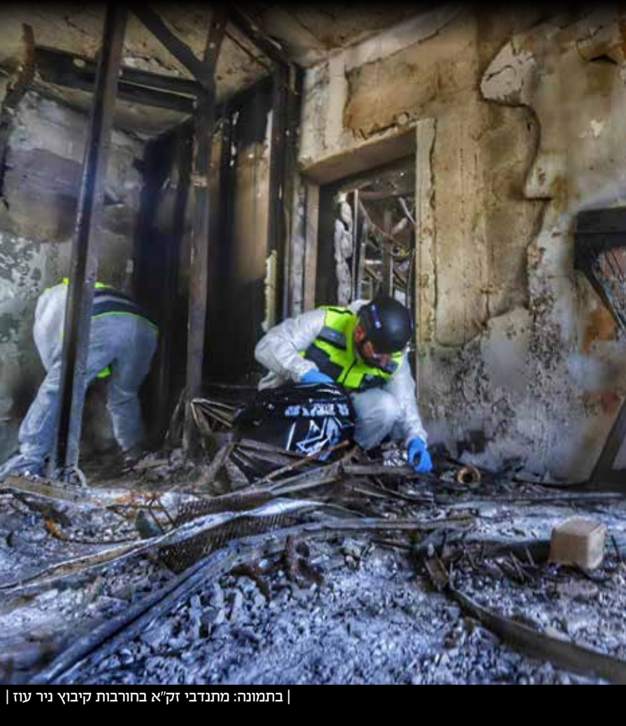
בתמונה: מתנדבי זק"א בחורבות קיבוץ ניר עוז |

...ונגענו דמי אבות ובנים, דמי רחמיניות וילדיהם, ונתערבו דמי אחים ואחיות ודמי אנשים ונשותיהם... ארץ אל תבכי דמם.... (מתוך סליחות ו' באדר)