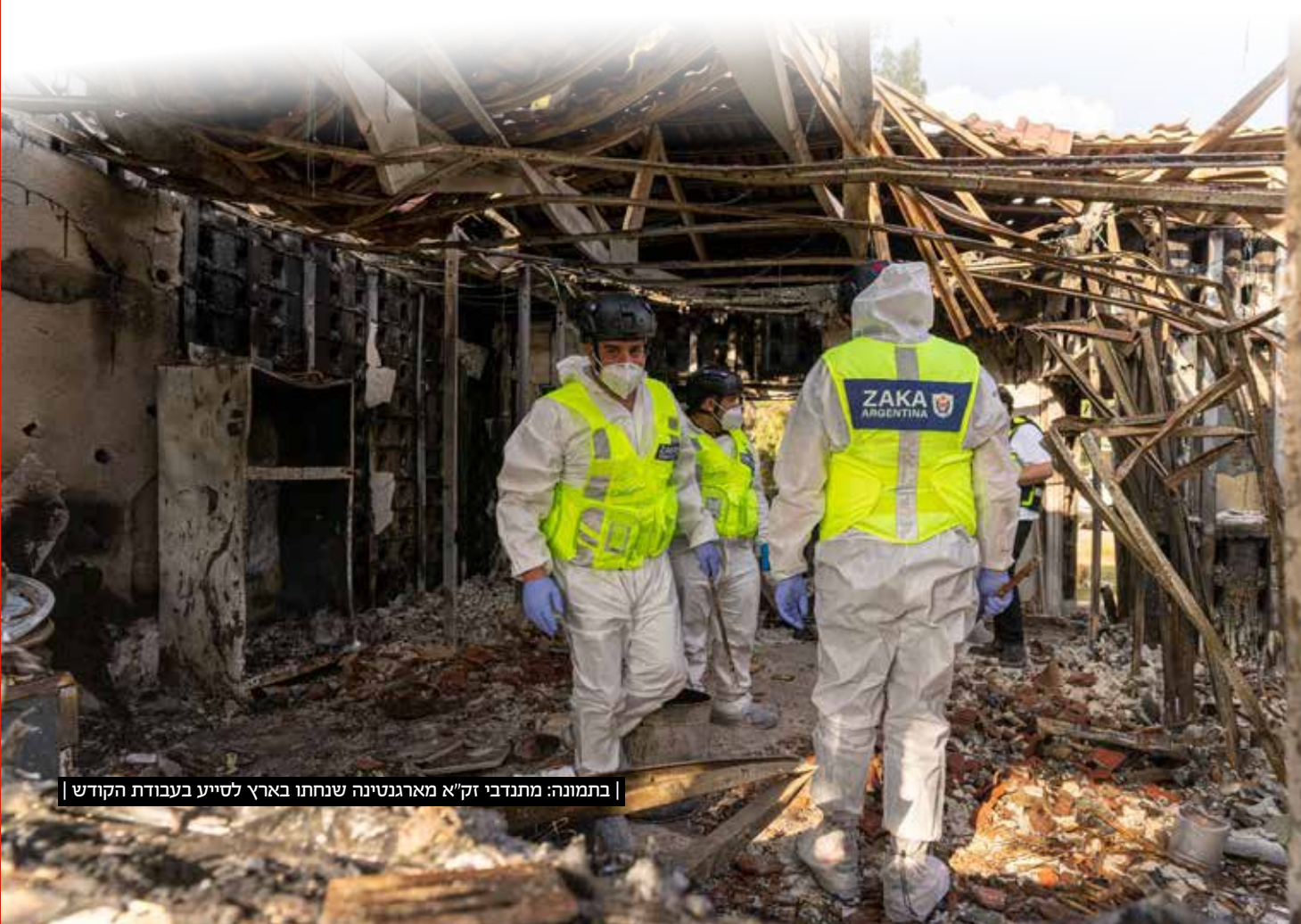
בתמונה: מתנדבי זק"א מארגנטינה שנחתו בארץ לסייע בעבודת הקודש |