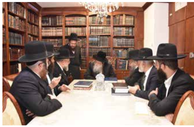
כ"ק האדמו"ר ממודז'ץ |