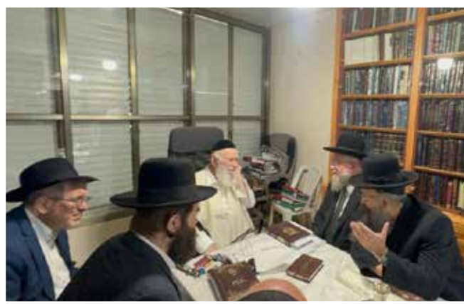
הגאון רבי יצחק זילברשטיין |