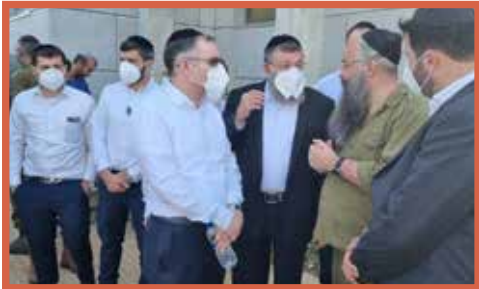
שר העבודה ח"כ יואב בן צור ומנכ"ל משרדו ישראל אוזן במחנה שורה |