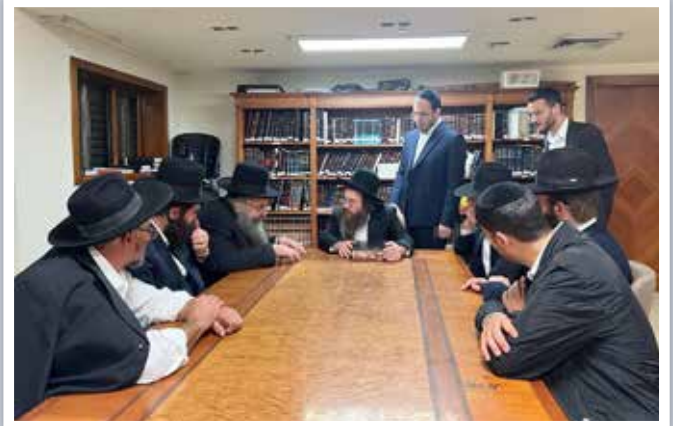
| הגאון רבי עמרם פריד |