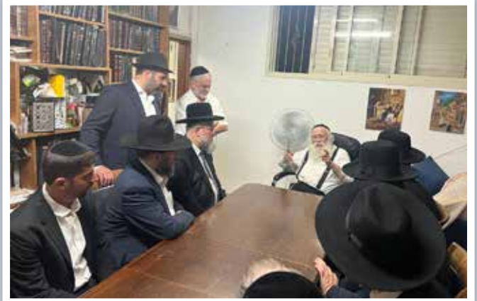
| הגאון רבי יהודה סילמן |