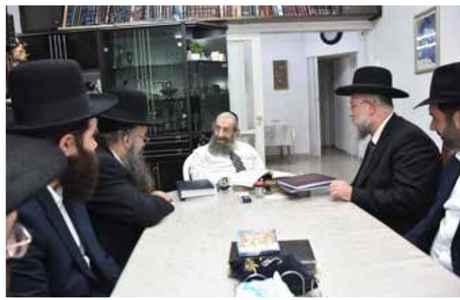
| הגאון רבי מסעוד בן שמעון |