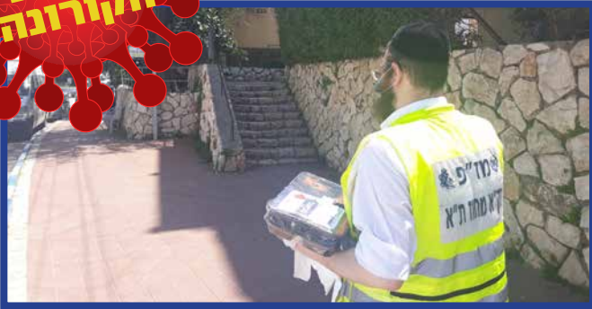
מתנדב זק"א בחלוקת מזון בבני ברק |