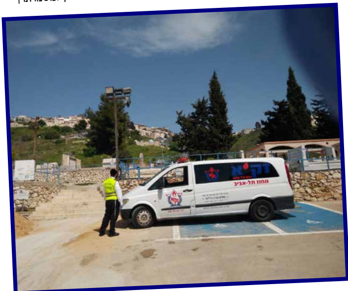
העברת נפטר קורונה לצפת |

מתנדבי זק"א תל אביב עומדים בחזית המערכה מול מגפת הקורונה הן בתחום הסיוע הקהילתי והן בתחום השמירה על כבוד המת.