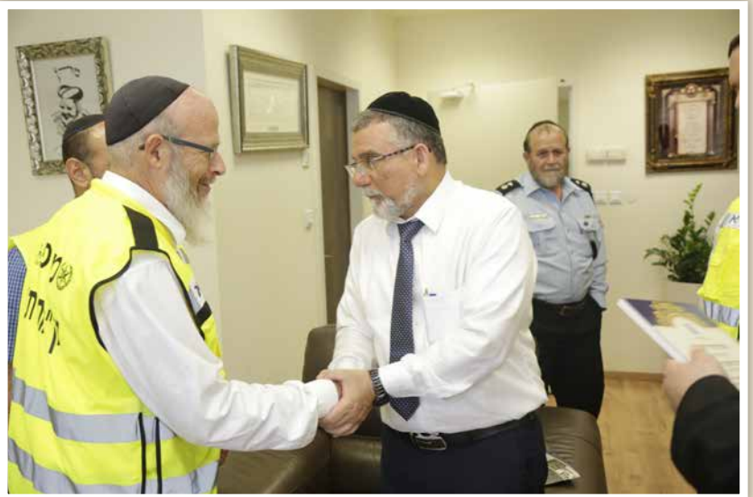
| עם השר לשרותי דת הרב יצחק ועקנין שיבלחט"א בקבלת פנים למשלחת זק"א שיצאה לבלרוס