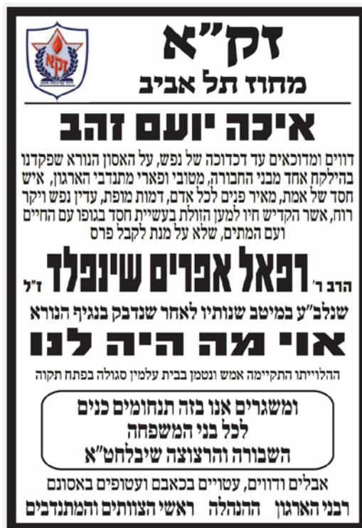
[ מודעת אבל שפורסמה בחוצות ]