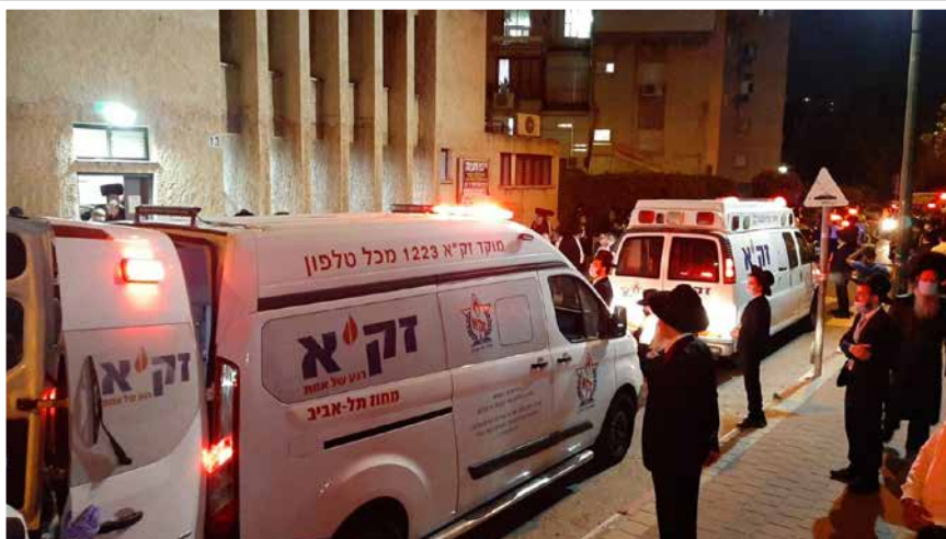
במסע ההלוויה |