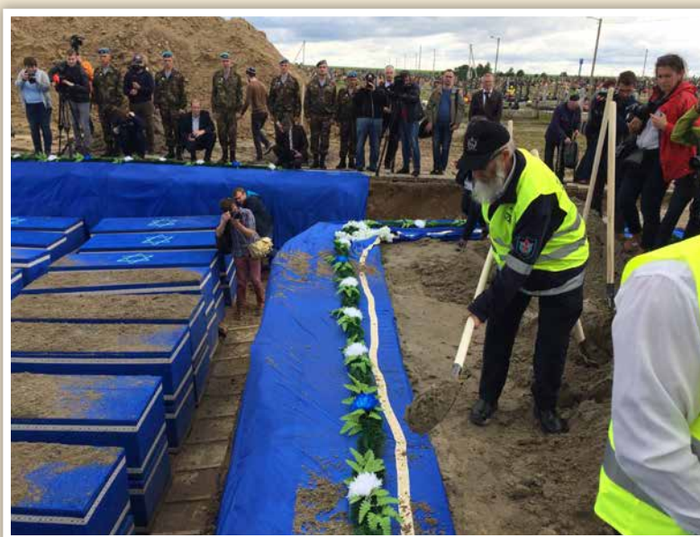
| בקבורת קדושי השואה מהעיר בריסק בבלרוס הי"ד |

הר' רפאל לא רק שלא ציפה לתשלום, כבוד ושבחים,