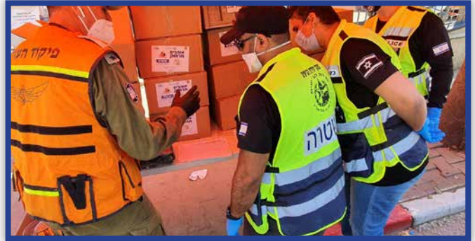
מתנדבי יחידת הגיפים בחלוקת מזון בבני ברק |