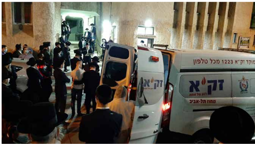
במסע ההלוויה |