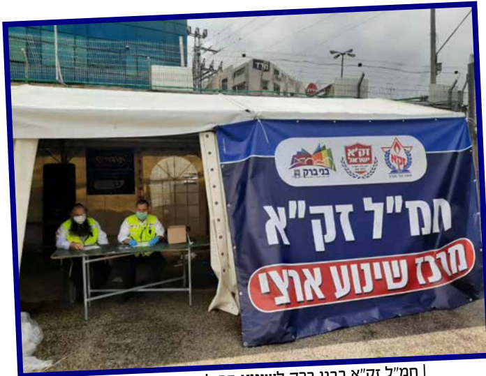
חמ"ל זק"א בבני ברק לשינוע חבילות מהעיר החוצה בימי הסגר |