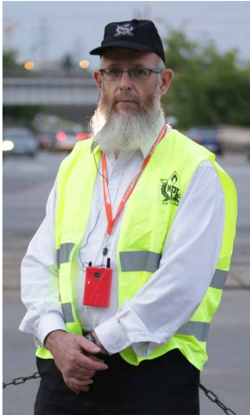
[ במסע מתנדבי זק"א לפולין - תשע"ח ]

היית אחד מן החבורה, ועכשיו התרנוך מכל החבורות, היית לי חבר, היית לי כאח, אחד מן החבורה שמת ידאגו כל החבורה. בחוץ תשכל חרב, נחפשה דרכנו ונשובה אל ה', ונמשיך בדרכך להרבות זכויות לעם ישראל, למען תיבלם המגיפה ומי שאמר לעולמי די יאמר לצרותינו די.