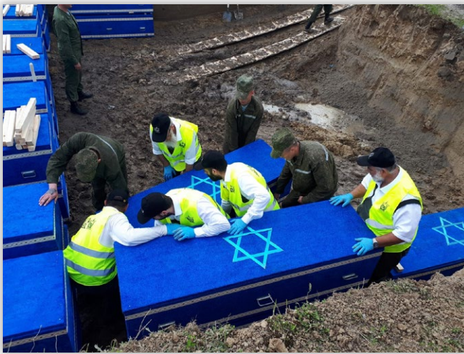
בעבודת הקודש לצד חיילי בלרוס |