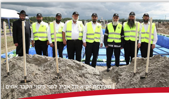
משלחת זק"א תל אביב לפני כיסוי הקבר אהים |

הרכבת בעיר ממנה הוסעו לתחנת 'ברונה גורה' הידועה לשמצה. התחנה, שהייתה אתר רצח המוני של יהודים בתקופת השואה, הביאה למותם של תושבי בריסק הנוותרים. מתוך קהילה יהודית מפוארת שמנתה עשרות אלפי נפשות, הצליחו להסתתר כ-19 יהודים בלבד ששרדו את התופת.