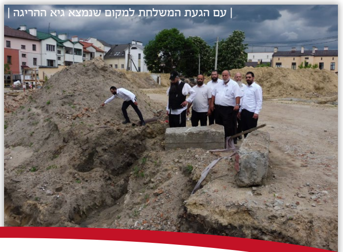
עם הגעת המשלחת למקום שנמצא גיא הריגה |