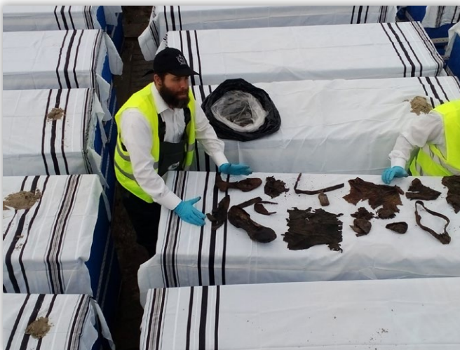
ממיינים פריטים שנמצאו בין הקדושים |