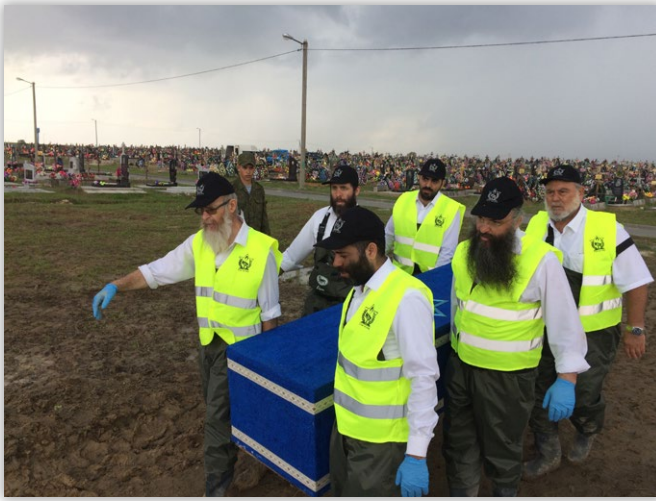
בהעברת ארונות הקדושים לקבורה |