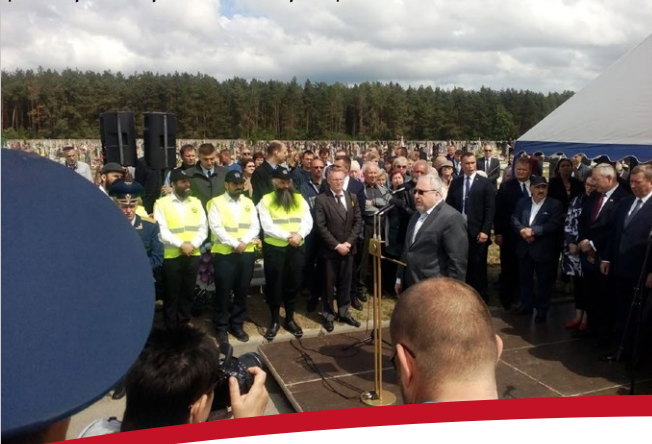
| בטקס הממלכתי לקבורת הקדושים |