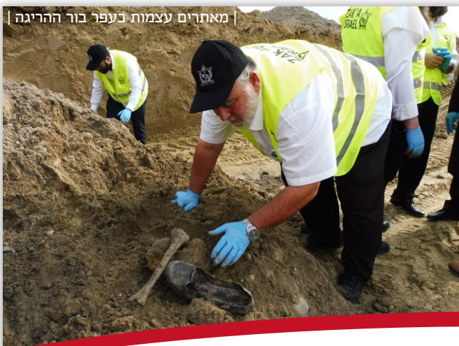
מאתרים עצמות בעפר בור הריגה |

כבר בימים הראשונים לכיבוש העיר בריסק, עוד בטרם הספיקו התושבים מוכי ההלם לעכל את הכניעה, נחטפו