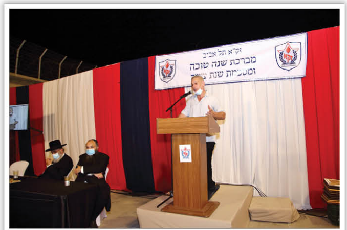
ד"ר חן קוגל, מנהל המכון הלאומי לרפואה משפטית |