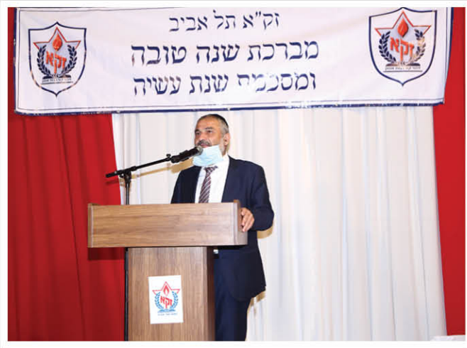
| ח"כ הרב משה אבוטבול |