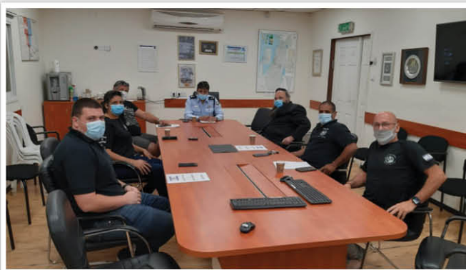
| במפגש היכרות עם כניסתו לתפקיד מת"ח מסובים |

בפני מפקד התחנה נמסרה סקירה על מגוון פעולותיה של היחידה וההישגים הרבים בהצלח