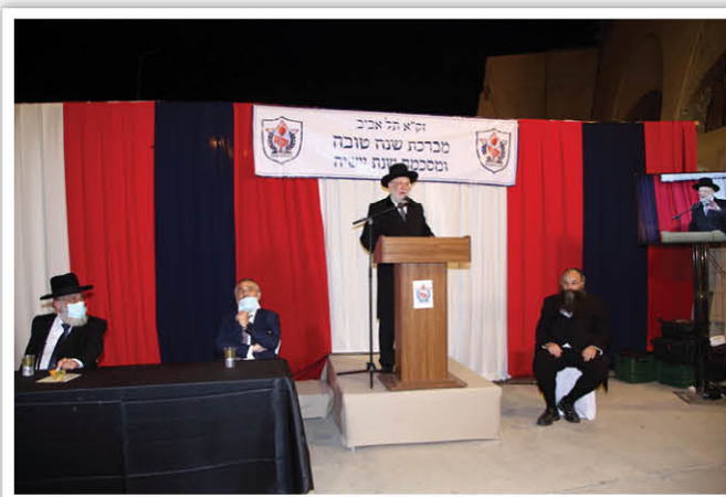
הרב ישראל מאיר לאו, הרב הראשי |