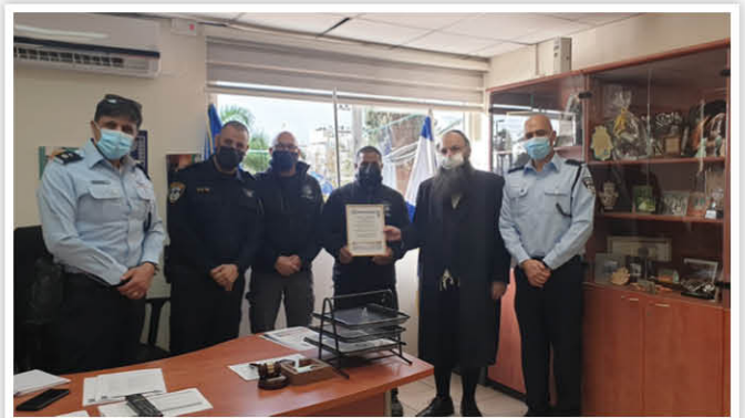
| בהענקת תעודת הוקרה בלשכת מת"ח מסובים |