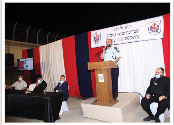
| נצ"מ הרב רמי ברכיהו, רב משטרת ישראל |

בית שמש בכל הנדרש בתחום כבוד המת ואף במקרה אישי בו היה למשפחתו דאג הרב רוז'ה במסירות. למתנדבים חולק שי נאה לחג, שופר ולוח שנה מהודר מתנת רשת "יש". על הצד האומנותי הופקד הקלידן והזמר יהודה רושגולד שהנעים במהלך כל הערב בשירי הזמן.